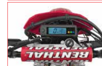
Contacteur à clé