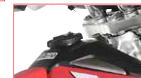
Bouchon de réservoir à clé